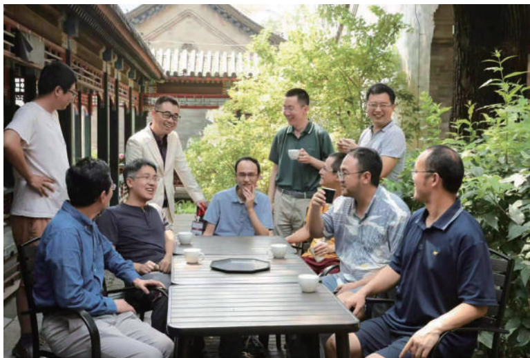
“黄金一代”齐聚怀新园

我们数学学科有个特点，数学是一个极其重视“人”的学科，这些年北大数学一直把“人”的作用放在首位，在全球范围内吸引、汇聚一流数学家前来工作，为优秀人才提供“不打扰”的优良工作环境。近年来，除了吸引多位领军数学家加盟，还有包括“北大数学黄金一代”成员在内的一大批优秀青年数学家也陆续前来工作。已有的在校教师与新入职的教师形成合力，加上体制机制的优化和创新，产生了突出的人才效应，推动北大数学不断前进，不断取得新的重大成绩。以国际数学家大会为例，受邀在国际数学家大会上做报告，代表着国际数学界对数学家研究成果的高度认可。去年的国际数学家大会，我们北大数学学科有6位教授受邀作大会报告。据不完全统计，这与普林斯顿大学、麻省理工学院、伯克利等世界顶尖数学院系受邀做报告的人数相当。像这样有这么多个特邀报告的，在我国数学发展历上是史无前例的。