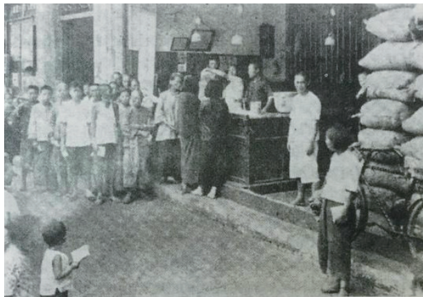
抗战初期米号前排队情景

阿廷离开德国以后，张禾瑞的学业是在著名的代数学家维特的指导下完成的。维特是原创性极高的代数学家，在国外任何一部标准代数课本（如Lang或Jacobson写的）都载有他的维特环，线性代数课本有他的二次型维特理论，还有那些维特多项式简直是神奇公式。