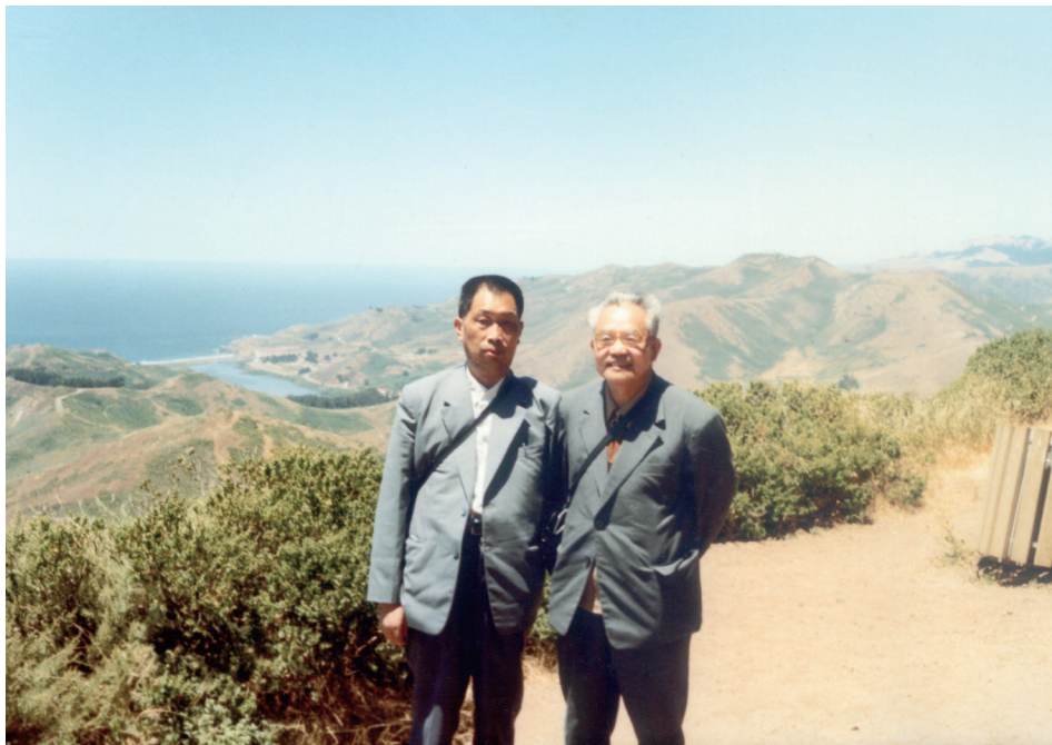
廖山涛与吴文俊在美国旧金山（1979年）

山涛的评审意见有15页。廖山涛对吴文俊申报奖励的8篇论文逐篇做了说明，并给出了总评意见：