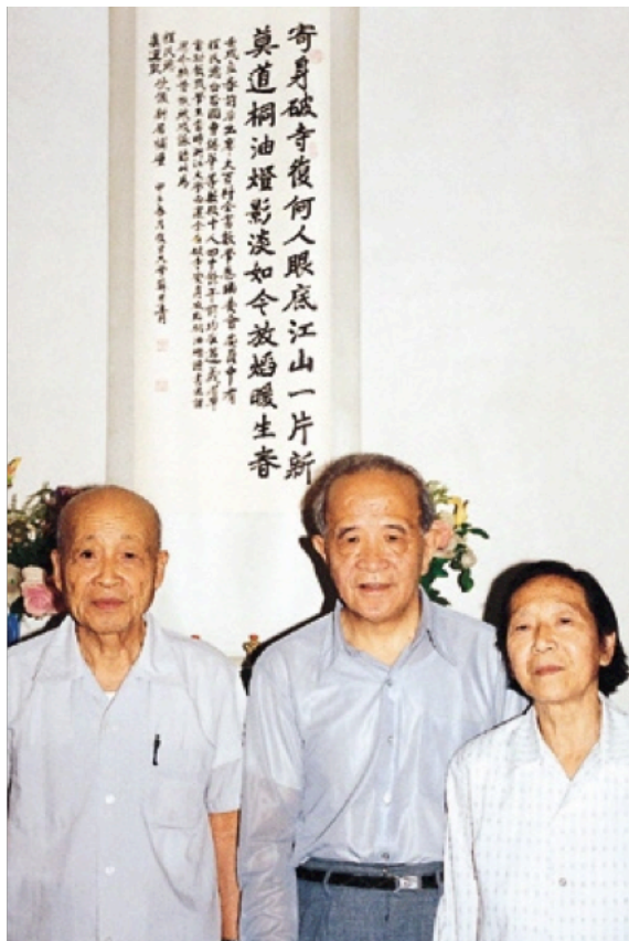
程民德夫妇与苏步青先生在家中合影。墙上挂着苏老题词并书写的条幅：“寄身破寺复何人，眼底江山一片新。莫道桐油灯影淡，如今放焰暖生春。”

术和行政领导职务，起到了设计师、伯乐的角色，是北大数学系有口皆碑的人物；他还是国家自然科学基金委数学学科重要的创建人，为振兴中国数学做出了杰出的贡献。