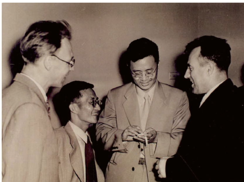
1953年华罗庚(左三)和冯康(左二)访问苏联